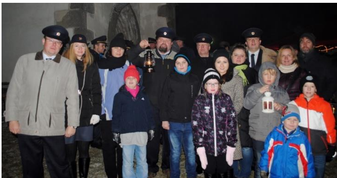
Účastníci výpravy za Betlémským světlem z Ločenic.