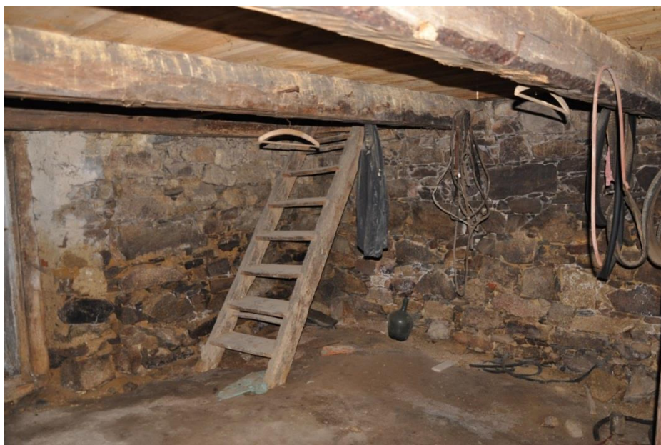
Komorová špýcharová část v obytné budově.