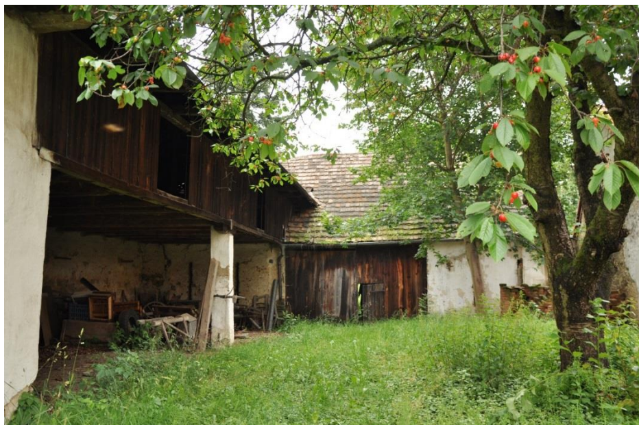
Kolna a stodola v zadní části dvora.